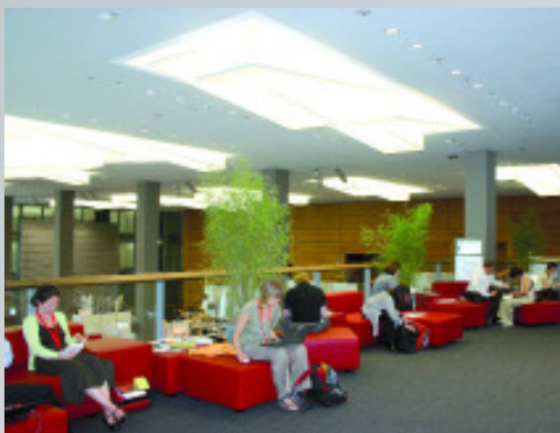
"The Deutscher Bibliothekartag is now the largest congress of its kind in Europe."

TW: Next year's Deutscher Bibliothekartag will be staged in Erfurt. Will the organization model developed